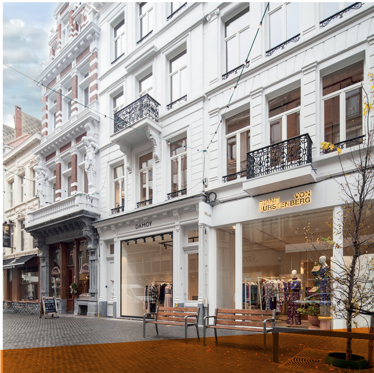
Anvers - Steenhouwersvest 44-46-48

VASTNED RETAIL BELGIUM SA, société immobilière réglementée publique de droit belge, Taco de Groot, Rudi Taelmans ou Reinier Walta, tél. + 32 3 361 05 90, www.vastned.be